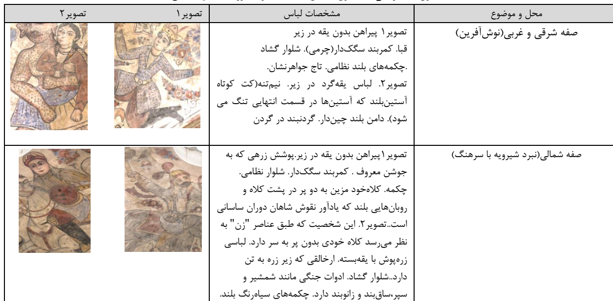
جدول ۶. نگارهایی با مضمون داستان‌های عامیانه و فلکلوریک. (نگارنده گان)

پوشاک نبرد در دوره قاجار متفاوت بوده است. «در این دوره برخلاف دوره‌های قبل دیگر استفاده از کلاه خود، سپر و زره رایج نبود و پوشاک نبرد عبارت بود از: کت سیاه‌رنگ و چسبانی که با نوارهایی تزئین می‌شد. شلوار گشاد و پرچینی که بلندای آن نزدیک به قوزک پا می‌رسید و در آن جمع می‌شد. چکمه و نیم چکمه‌هایی که بدون پاشنه بوده و پاچه شلوار در آن فرومی‌رفت. کلاه بلندی از پوست بره که در قسمت کلگی آن شکافی سرخ‌رنگ وجود داشت.» (محمدی، ۱۳۹۲: ۲۳۱) به نظر می‌رسد هنرمند برای پوشش و ویژگی‌های البسه در این نگارها بیشتر از نقاشی و تصاویر کتب رایج آن دوره سود برده است (ظفر کامل، ۱۳۹۶: ۱۱۵).