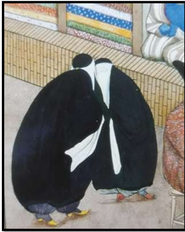
تصویر شماره 11، (روبنده)، اثر صنیع الملک، هزار و یک شب، 1269 ه.ق، منبع : کتابخانه کاخ گلستان