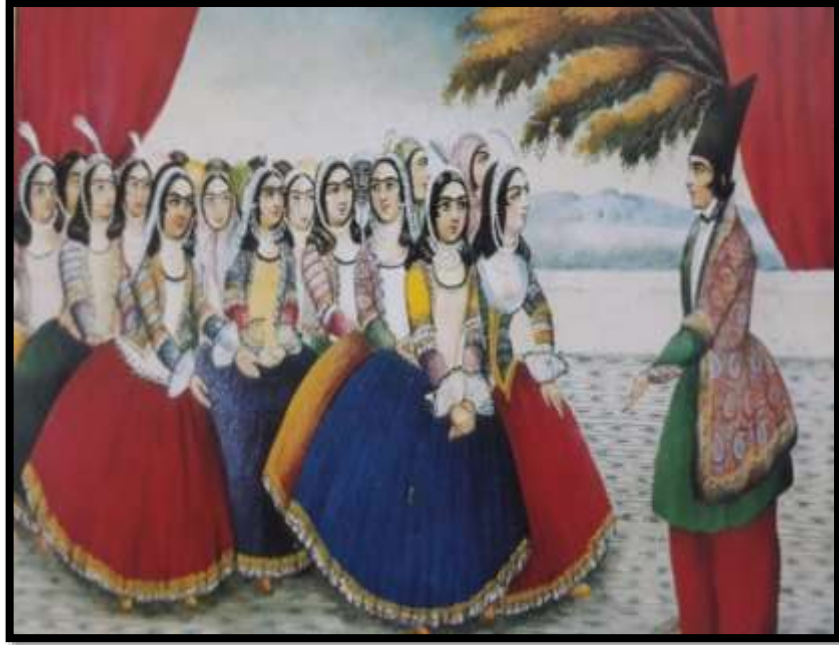
تصویر شماره 14، (پیراهن)، اثر صنیع الملک، هزار و یک شب، 1269 ه.ق، منبع: کتابخانه کاخ گلستان