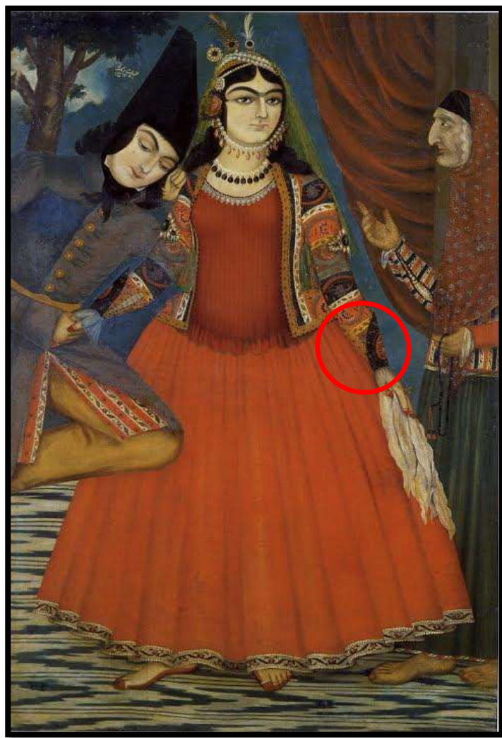
تصویر شماره 15، (ارخالق)، دو دل داده و پیرزن مشاطه، اثر صنیع الملک، هزار و یک شب، 1269 ه.ق

همانطور که در نقاشی "دو دل داده و پیرزن مشاطه" نمایان است، در قسمت آستین ارخالق، سردست مثلثی یا گلابی وجود دارد، که روی ساعد برگردانده میشود و به آن "سمبوسه" میگویند؛ معمولا این سمبوسه ها گران تر از پارچه ی اصلی ارخالق بودند. (تصویر شماره 15)