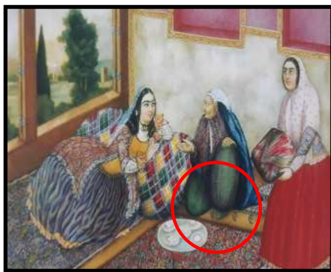
تصویر شماره 3، (چاقچور سادات)، اثر صنیع الملک، هزار و یک شب، 1269 ه.ق

پرچین بود و برای اینکه چتری بایستد گاهی فنهایی در زیر آستر آن قرار می دادند یازیرتنبان های آهارزده و پنبه دوزی شده می پوشیدند «(ذکاء، 1336 : 25). در ادوار متأخر قاجاری «در اندرون، ابتدا بانوان به پوشیدن شلیته و تنبان قناعت می کردند ولی با ورود شلوارهای کشی تنگ و چسبان به پوشاک بانوان این دوره تنکه تنبان اضافه گردید»(انجمن بین المللی زنان در ایران، 1352 : 7).