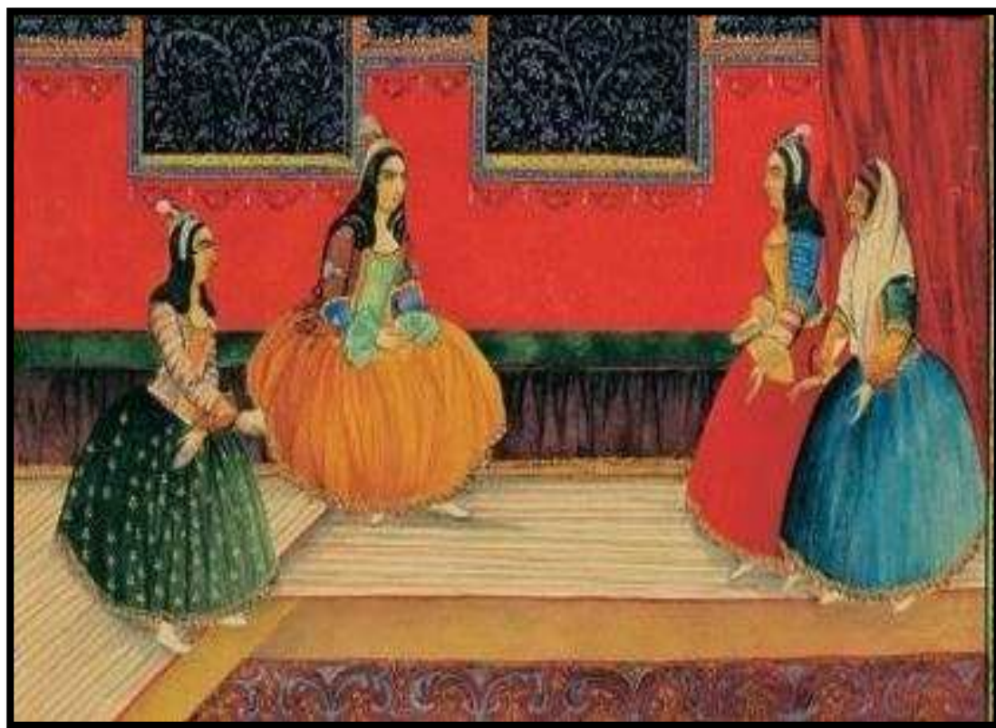
تصویر شماره 17، (دامن)، اثر صنیع الملک، هزار و یک شب، 1269 ه.ق، منبع : کتابخانه ی کاخ گلستان

همان طور که در تعداد زیادی از آثار کتاب هزار و یک شب قابل مشاهده است، دامن زنان در اوایل دوره ی قاجار بسیار پرچین و بلند بوده، بلندی این دامن ها به حدی است که گاهی روی زمین کشیده می شوند، به همین علت بود که در این دوره شلوار اهمیت خود را از دست داد؛ زیرا شلوار ها زیر این دامن های کلوش و اغلب با رنگ های روشن مشخص نبودند. (تصویر شماره 17) معمولاً دامن های این دوره، بدون نقش و ساده می باشند؛ اما در برخی از تصاویر، نقوش ختایی روی دامن ها قابل مشاهده است. (تصویر شماره 19) همچنین اگر با دقت به تصویر دو دل داده نگاه کنیم، می توانیم پیراق دوزی ها و گلابتون دوزی های فاخری را در حاشیه دامن ببینیم، که به نوعی از تزیینات دامن به شمار می آید. (تصویر شماره 15)