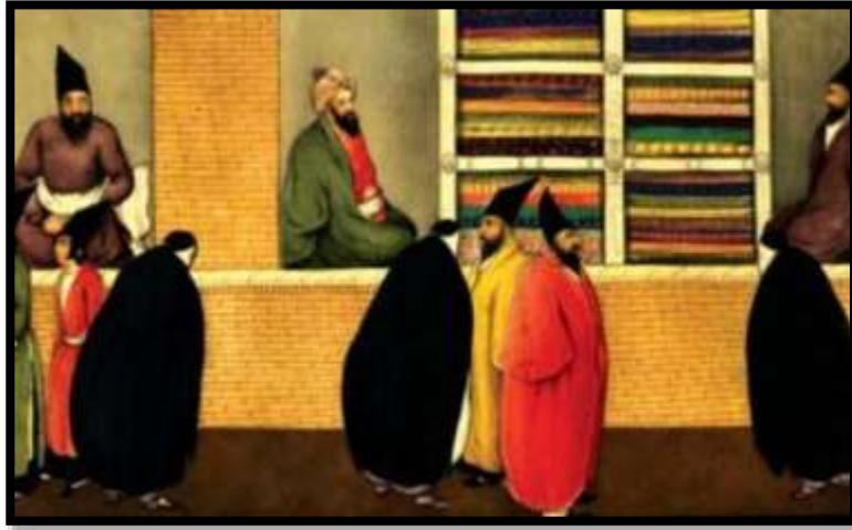
تصویر شماره 7، (چادر کمری)، اثر صنیع الملک، هزار و یک شب، 1269 ه.ق

بر اساس اسناد تاریخی «در دوره نخست قاجار چادر نماز به سر کردن و بستن چارقد زیر گلو معمول نبود بلکه مانند دوره پیشین (عصر زندیه) توری و کلاهک، سر بانوان را زینت می داد. گیسوها را به طور موج و به حالت بافته و پشت سر می ریختند و در انتهای آن، زیورهای مرواریدگون یا گوی های زرین نصب می کردند» (انجمن بینالمللی زنان در ایران، 1352 : 6). همانطور که در نقاشی میرزا ابوالفضل طیب کاشانی و بیمار قابل مشاهده است، زنان علاوه بر چادرهای سیاه کمری و چادرهای رنگی، چادر های چهارخانه ی "آبی، قهوه ای" به سر دارند که به آن «چادر شب» می گفتند؛ چادر شب ها عمدتاً در اندرونی استفاده می شد زیرا بسیار نازک بود و به زن ظرافت میبخشید. (تصویر شماره 8)