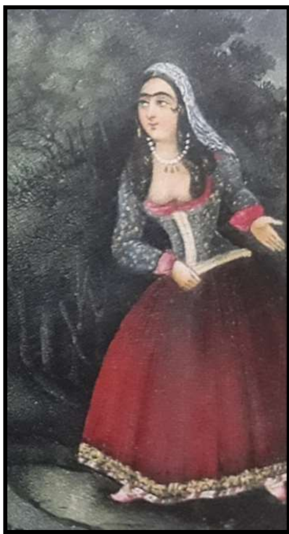
تصویر شماره 16، (شاپکین)، اثر صنیع الملک، هزار و یک شب، 1269 ه.ق، منبع: کتاب خانه کاخ گستان

شاپکین ها معمولا از جنس زربفت های بسیار گران بودند؛ همچنین آنها مزین به قلاب دوزی های مروارید و الماس بودند و بیشتر توسط زنان دربار مورد استفاده قرار می گرفتند.