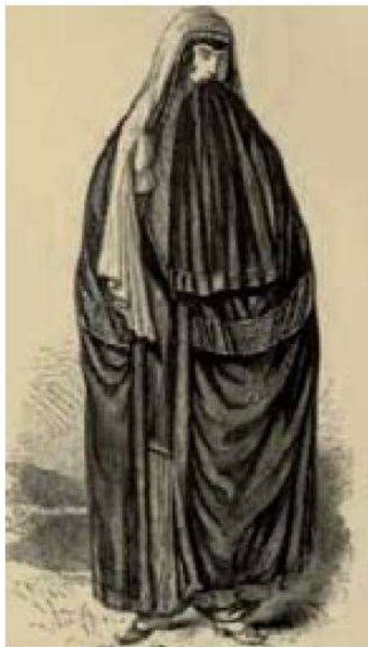
تصویر شماره 5 (راست)، زن قاجار در لباس بیرون از خانه