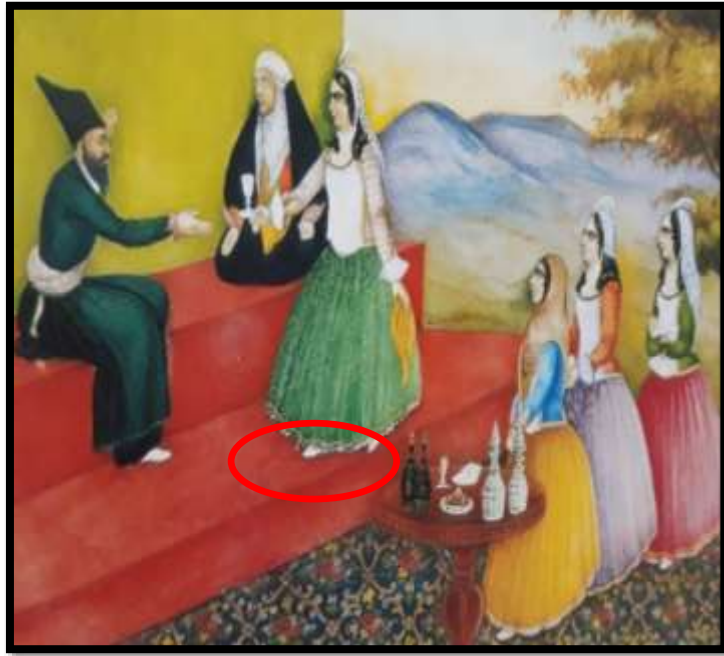
تصویر شماره 13، (جوراب های سفید دست بافت)، خیاط و زن صحبت داشتن، اثر صنیع الملک، هزار و یک شب، 1269 ه.ق، منبع : کتابخانه ی کاخ گلستان