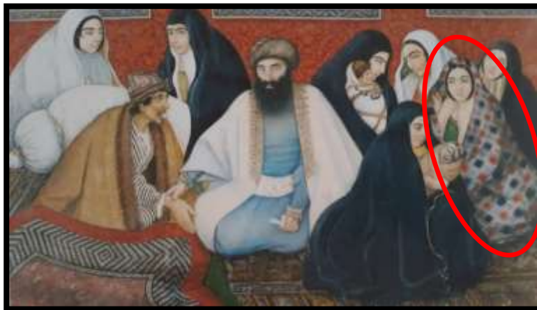
تصویر شماره 8، (چادر شب)، میرزا ابوالفضل طیب کاشانی و بیمار، اثر صنیع الملک، هزار و یک شب، 1269 ه.ق

بر اساس اسناد تاریخی «در دوره نخست قاجار چادر نماز به سر کردن و بستن چارقد زیر گلو معمول نبود بلکه مانند دوره پیشین (عصر زندیه) توری و کلاهک، سر بانوان را زینت می داد. گیسوها را به طور موج و به حالت بافته و پشت سر می ریختند و در انتهای آن، زیورهای مرواریدگون یا گوی های زرین نصب می کردند» (انجمن بینالمللی زنان در ایران، 1352 : 6). همانطور که در نقاشی میرزا ابوالفضل طیب کاشانی و بیمار قابل مشاهده است، زنان علاوه بر چادرهای سیاه کمری و چادرهای رنگی، چادر های چهارخانه ی "آبی، قهوه ای" به سر دارند که به آن «چادر شب» می گفتند؛ چادر شب ها عمدتاً در اندرونی استفاده می شد زیرا بسیار نازک بود و به زن ظرافت میبخشید. (تصویر شماره 8)