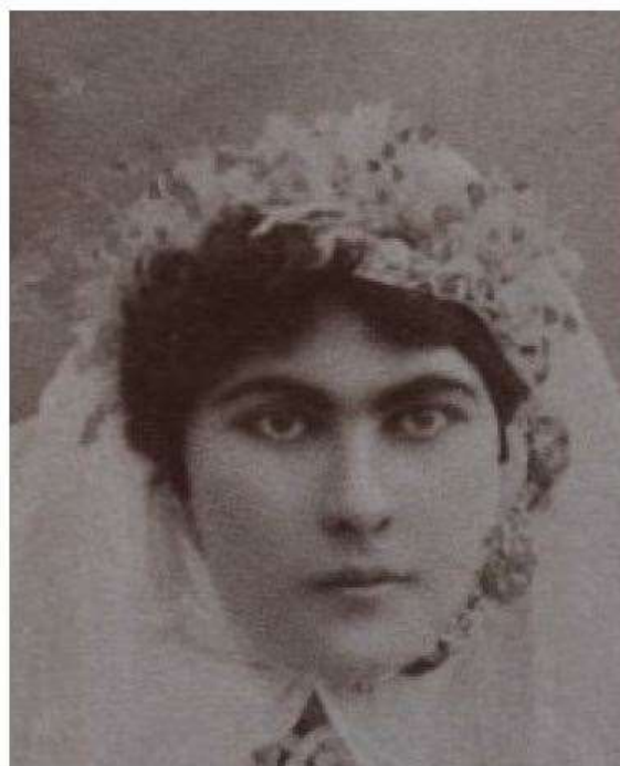
تصویر شماره 20 (راست)، زن قاجاری، (بخشی از تصویر)،