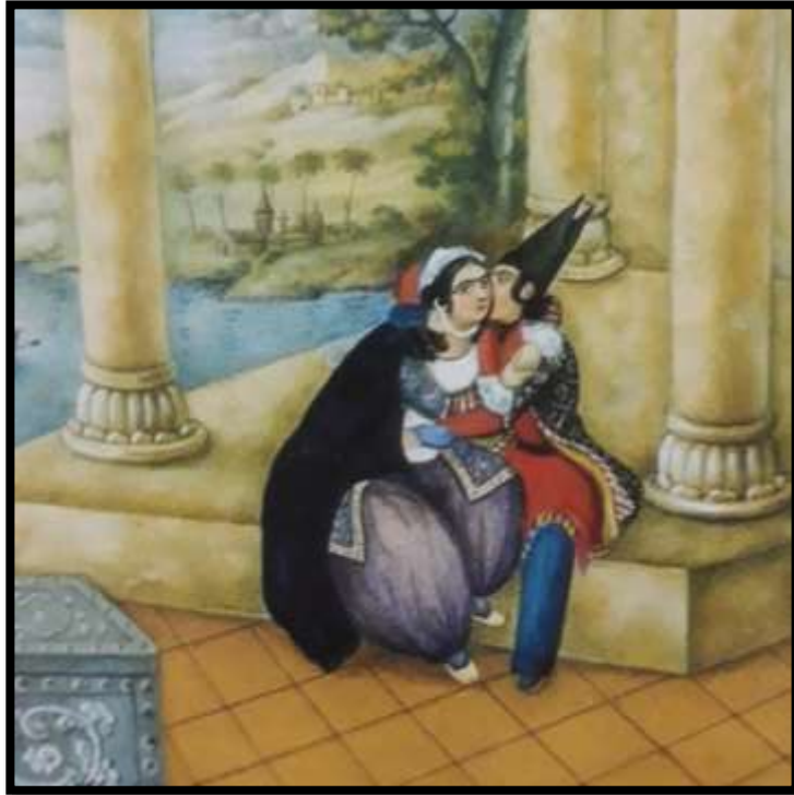
تصویر شماره 4. (چاقچور)، اثر صنیع الملک، هزار و یک شب، 1269 ه.ق