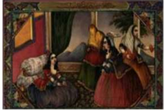
تصویر شماره 9 (راست)، حیات النفوس از قصر پدر مراجعت کرده متغیر است، اثر صنیع الملک، هزار و یک شب، 1269 ه.ق