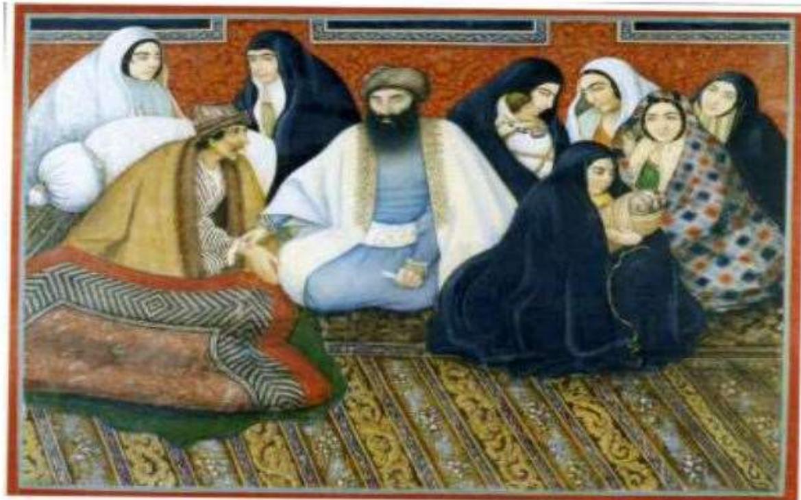
تصویر شماره 2، میرزا ابوالفضل کاشانی طبیب و بیمار، اثر صنیع الملک، رنگ و روغن روی بوم