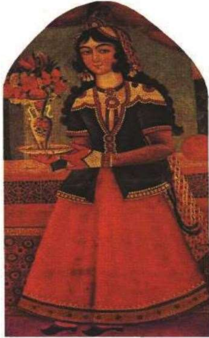
تصویر شماره 1، زن جوان با گلدان، منسوب به محمدحسن، رنگ وروغن روی بوم، اوایل سده سیزدهم/ اوایل سده نوزدهم، منبع : کاخ موزه سعدآباد تهران