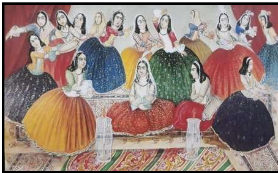
تصویر شماره 19، (جواهرات)، عروسی سه دختر جهت ملک زادگان، اثر صنیع الملک، هزار و یک شب، 1269 ه.ق

مجموعه ی بسیار ارزشمندی از جواهرات قاجار هم اکنون در بانک مرکزی تهران وجود دارد که شامل انواع جواهرات سلطنتی، تاج ها، کمربند ها و... می باشد.