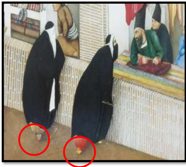
تصویر شماره 12، (ساغری)، صحبت داشتن خادم با مرد خیاط، اثر صنیع الملک، هزار و یک شب، 1269 ه.ق

بانوان این دوره در اندرونی و فصول گرم سال پا برهنه بودند، اما در زمستان از جوراب های سفید دست بافت و مزین شده استفاده می کردند. (تصویر شماره 13)