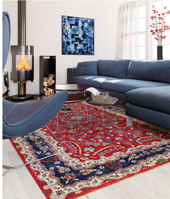
تصویر ۵: قالی ایرانی با طرح افشان و زمینه قرمز درخشان و حاشیه آبی لاجورد