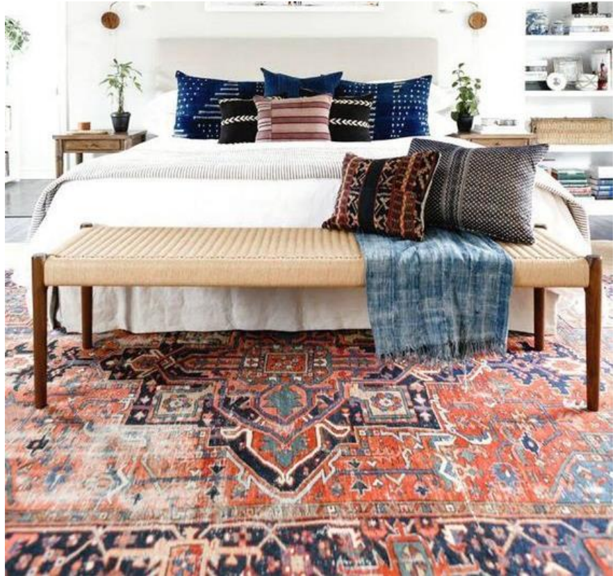
تصویر ۳: همراهی و هم‌پیوندی قالی ایرانی با دکوراسیون داخلی، قالی بافت سراب (راست) و قالی کناره بافت قوچان (چپ)