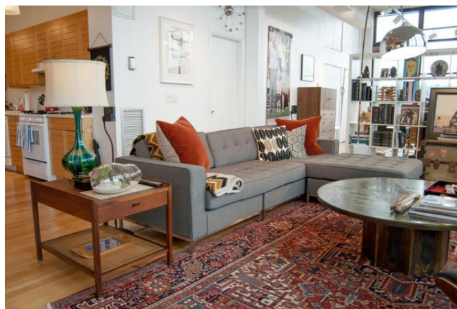
تصویر ۸: قالی ایرانی با طرح و نقش هندسی (انتزاعی) روستائی، ملایر (همدان) چالستر (چهار محال و بختیاری)