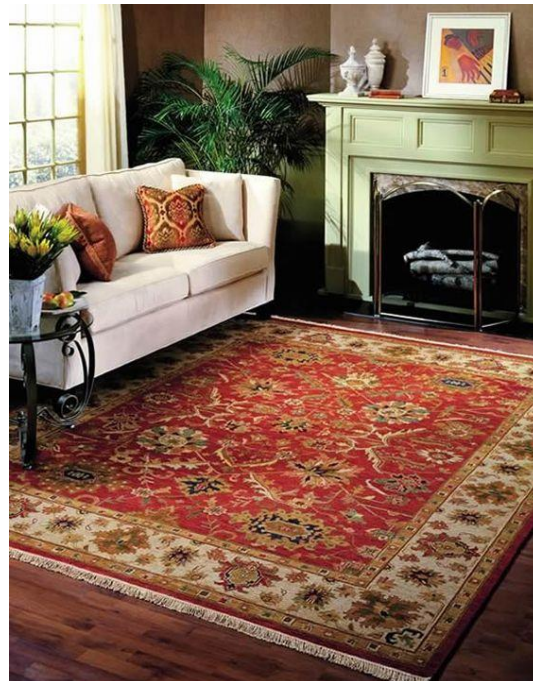
قالی دست- بافت

تصویر ۱: قالی ایرانی و هم‌پوشانی با دکوراسیون داخلی، نقش افشان و زمینه لاک‌ی (راست) و قالی عشایری ترکمن با نقش گول (چپ)