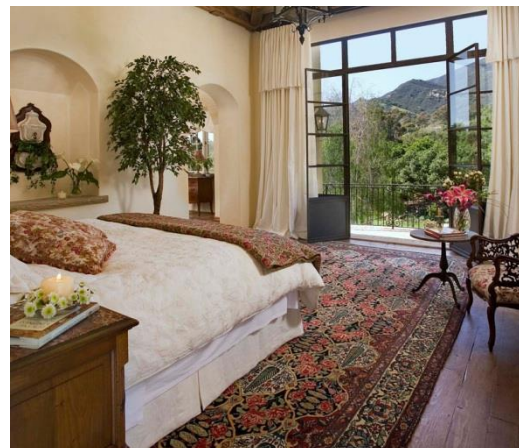
تصویر ۷: قالی ایرانی با طرح خشت سرو لوزی بافت چالستر (چهار محال و بختیاری)