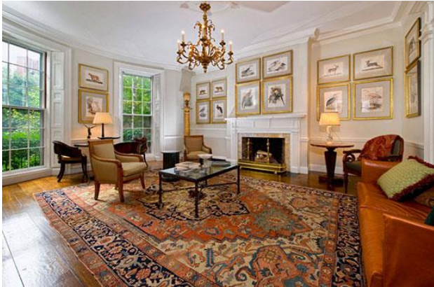
تصویر ۶: قالی ایرانی با طرح انتزاعی عشایری، بافت سراب

طرح به صورت یکسان در همه زمینه توزیع شده است و بالا و پائین قالی در این طرح معنایی ندارد و به صورت مطلوب می تواند از هر زاویه ای مورد نظر و نگاه باشد بدون این که دل زدگی ایجاد کند.