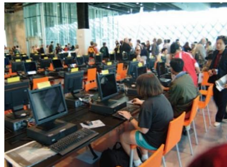
تصویر ۱-۱-۱ فضای داخلی مدیاتک سیاتل