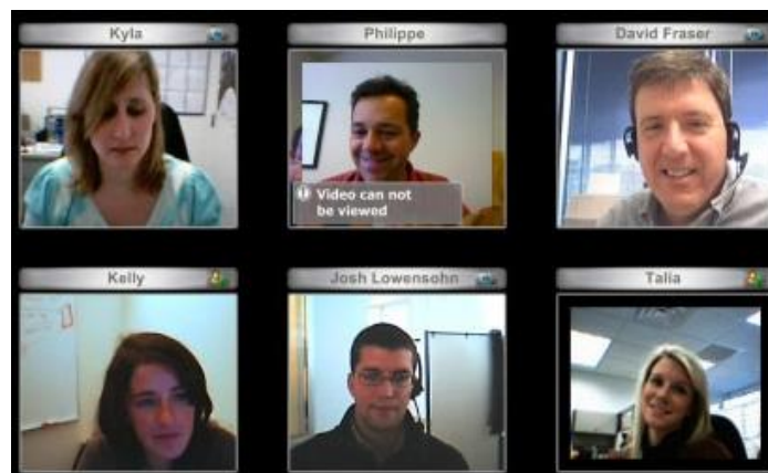
تصویر ۳ - عرصه عمومی مجازی (گفتگوی مردم در مکان های جغرافیایی متفاوت در یک زمان)

در واقع "چند رسانه ای" به کاربرد ها و برنامه هایی اطلاق می شود که در آنها برای ارائه اطلاعات به کاربر، رسانه های صوت، متن، گرافیک، انیمیشن، ویدیو و .... به صورت ترکیبی بکار گرفته می شوند. این نظام جدید به صورت "بزرگراه های اطلاعاتی" با پیشرفت های تکنولوژی، مرز میان متن، صدا و تصویر را که یک سیستم واحد ارتباطی می تواند مخابره کند را از میان می برد. رسانه ها، مخابرات، الکترونیک و کامپیوتر ها اکنون در یک شبکه بزرگ دیجیتالی چند رسانه ای با امکان تاثیر متقابل با یکدیگر ادغام شده و خدمات مرکبی را ارائه می دهند که تا اندکی پیشتر بر صفحه یک کامپیوتر خانگی یا تلویزیون پراکنده بود اما اکنون می توان با بهایی اندک همه نوع اطلاعات را دریافت، ذخیره و پردازش کرد و با آنها از در گفتگو در آمد، مثلا به کتاب های کتابخانه ای دسترسی یافت بدون اینکه لزوم به امانت گرفتن آنها باشد.