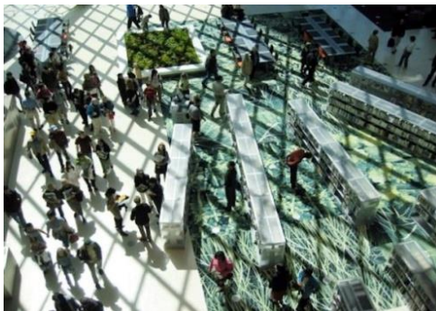
تصویر ۱-۱-۲ فضای داخلی مدیاتک سیاتل

مدیاتک معمولاً دارای بخش‌های مختلف است که عبارتند از: کتابخانه، فضای سمعی بصری، بانک‌های اطلاعاتی، سالن‌های بحث و گفتگو و... دلایل پیدایش این نوع مجموعه‌ها این بود که کتابخانه‌های سنتی دیگر قادر نبودند به تنهایی و بدون استفاده از رسانه‌های گروهی نیازهای مردم و به خصوص دانشجویان و محققان را در دسترسی اطلاعات برآورده کنند و بنابراین اکنون بهره‌گیری از پیشرفت سریع تکنولوژی، صنایع الکترونیکی و کامپیوتری، کتابخانه‌ها را مراکز دسترسی اطلاعات، نوشتار، تصاویر و صداها به سهولت و سرعت از یک منطقه در جهان به مناطق دیگر منتقل شده و در دسترس استفاده‌کنندگان که در مراکز دسترسی به رسانه‌های کمکی جمعی (مدیاتک) هستند قرار گیرند. اعضای این مجموعه‌ها می‌توانند با هزینه بسیار کم (حق عضویت سالانه) از این امکانات در ورای دنیای کتاب و کتابخانه‌ها استفاده کنند.