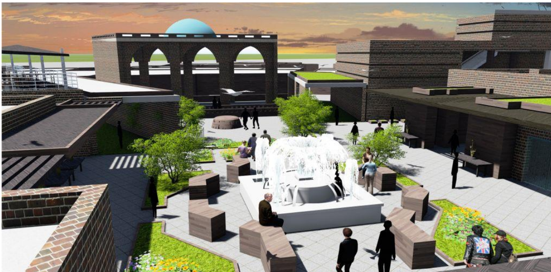
شکل ۶: دید پرنده از ورودی فرهنگسرا