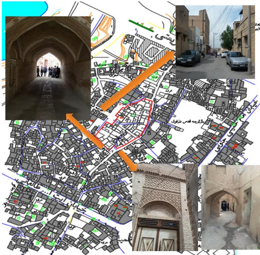
شکل ۲: پلان موقعیت سایت فرهنگسرا