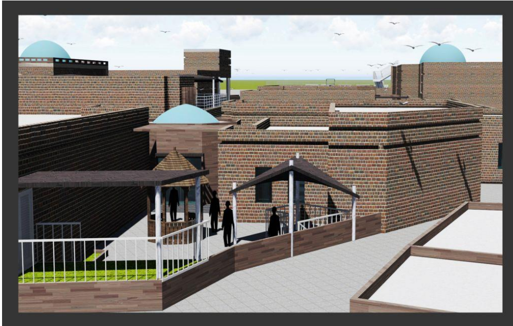
شکل ۷: دید پرنده از ضلع شمالی سایت