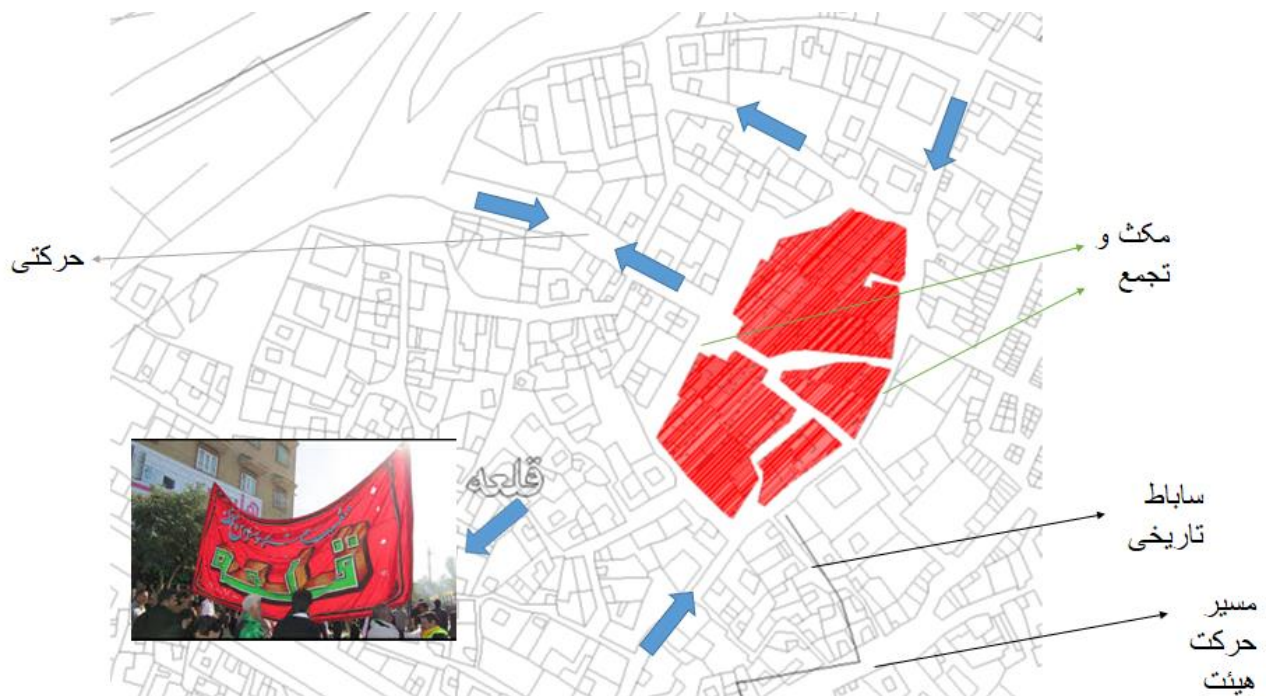
شکل ۳: مجاورت سایت فرهنگسرا و مسیر حرکت هیئت‌های عزاداری

در روز نهم و دهم یعنی تاسوعا و عاشورا مراسم خاص در دزفول برگزار می‌کند، بدین صورت که در این روزها مردم سه بار مجزا به‌طور کامل با هیئت‌های بزرگ خود بیرون می‌آیند و عزاداری می‌کنند. در دزفول بیش از صد هیئت عزاداری وجود دارد و شهر به دو قسمت تقسیم می‌شود که عصر تاسوعا تمامی قسمت جنوبی شهر به‌طرف قسمت شمالی شهر حرکت می‌کنند و در عصر عاشورا تمامی قسمت شمالی شهر به‌طرف قسمت جنوبی شهر حرکت می‌کنند و در خیابان‌های اصلی شهر عزاداری می‌کنند. در صبح عاشورا نیز همه مردم شهر و هیئت‌ها به محلی مشخص به نام رودبند حرکت می‌کند. محله قلعه دزفول که سایت فرهنگسرا در آنجا واقع شده است قدیمی‌ترین محله شهرستان دزفول می‌باشد که سالیان زیادی است سوگواران این محله در قالب یک هیئت متحده به عزاداری می‌پردازند. در جلوی این هیئت گروه مارش قرار دارد که خبر از ورود عزاداران را در سوگی عظیم می‌دهد و به دنبال آن سیل عظیمی از سوگواران که در عزای سید و سالار شهیدان سینه می‌زنند (مهندسان مشاور چغازنبیل، ۱۳۸۸).