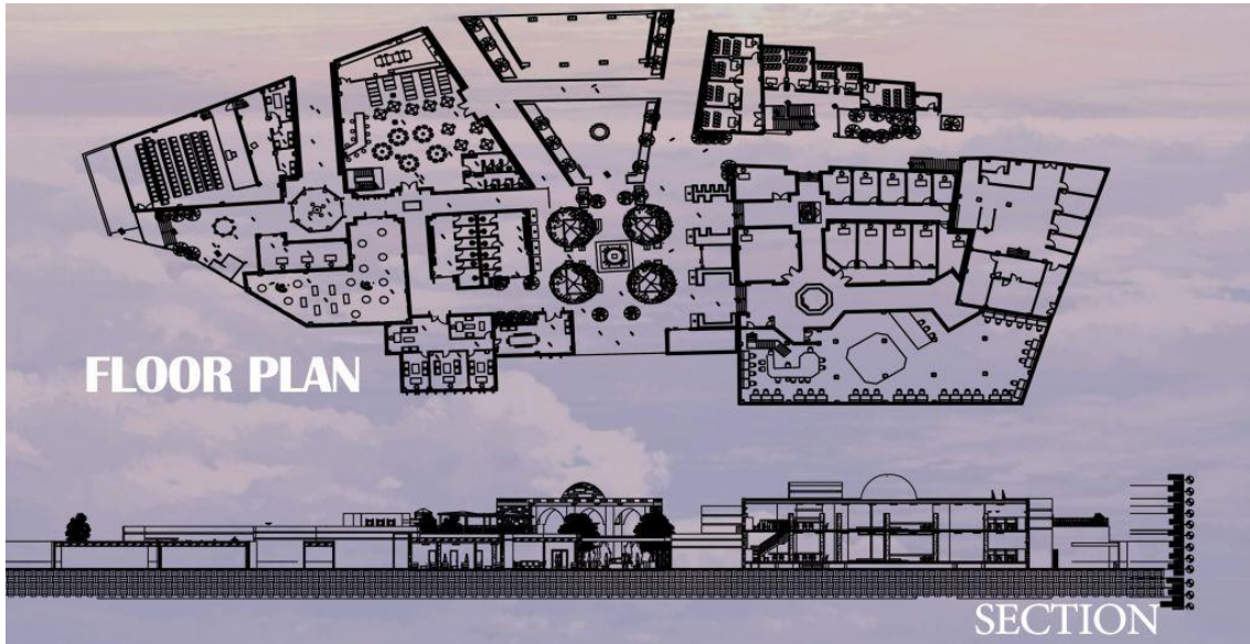
شکل ۵: پلان سایت و نمای فرهنگسرا طراحی شده