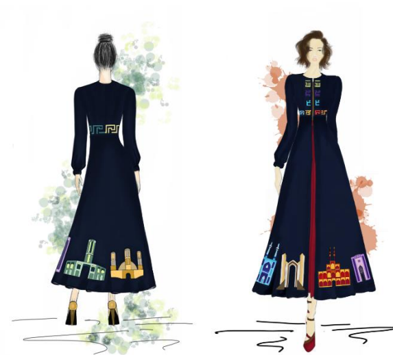
شکل ۳- طرح نهایی رنگی پیراهن دامن