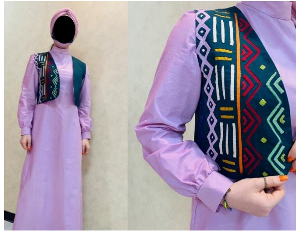
شکل ۷- دوخت نهایی جلیقه