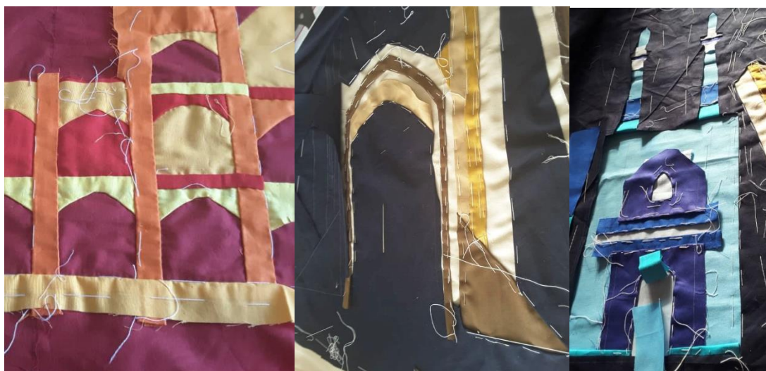
شکل ۶- مراحل دوخت پیراهن دامن با تکنیک مولا