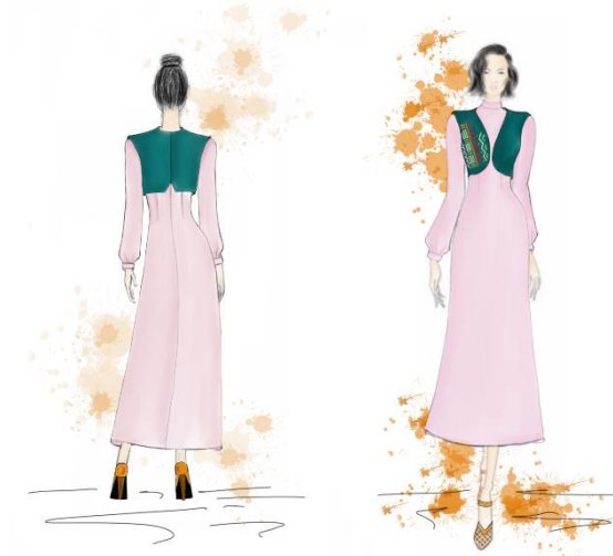
شکل ۲- طرح نهایی رنگی جلیقه