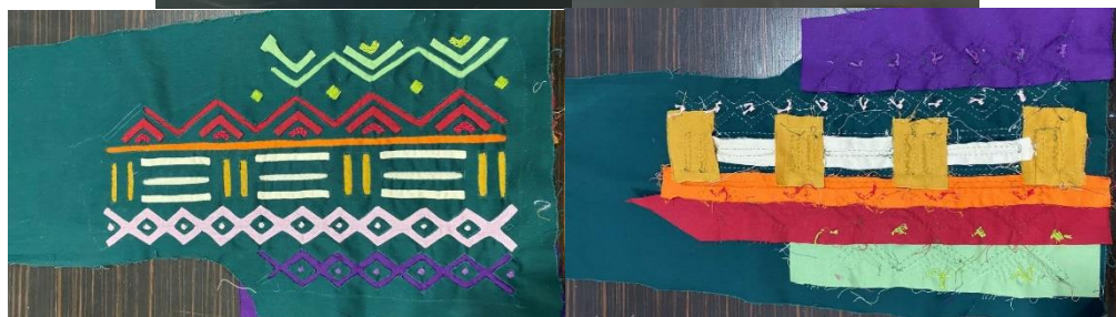
شکل ۵- مراحل دوخت جلیقه با تکنیک مولا