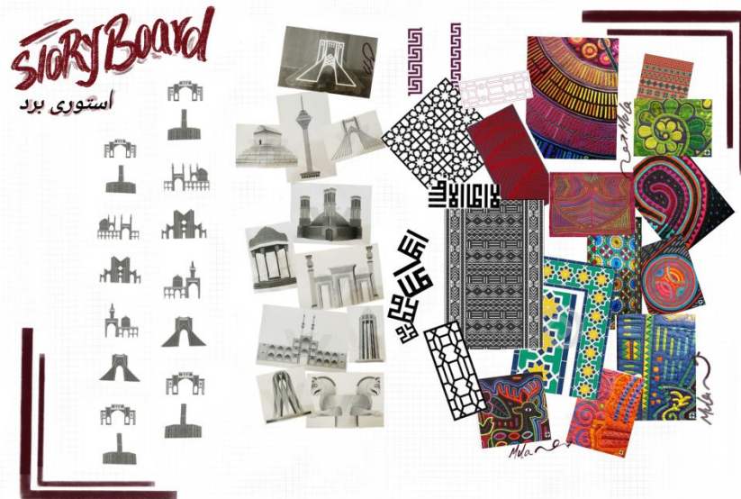
شکل ۱- استوری برد

مورد نظر برای دوخت نقش تعیین کننده‌ای در زیبایی اثر دارند. نقوش اولیه از طرح‌های مولاس (molas) با نقشمایه حیوانات با تاکید بر پرندگان بود. پس از بررسی مجدد این هنر و روش‌های اجرایی آن، از نقشمایه‌های بومی و محلی برگرفته از معماری ایرانی استفاده گردید. شهر یزد بعنوان یکی از پایگاه‌های مهم معماری تاریخی کشور شناخته می‌شود و تصمیم گرفته شد تا این نقوش مورد استفاده قرار گیرند. باید افزود که دلیل استفاده از پارچه‌های نخی و پنبه‌ای این است که چون بایست برش داده و سپس برگردانده شوند نیاز به پارچه‌ای است که لبه‌های برش داده شده ریش نشوند و قابلیت خم شدن بهتر را داشته باشند.