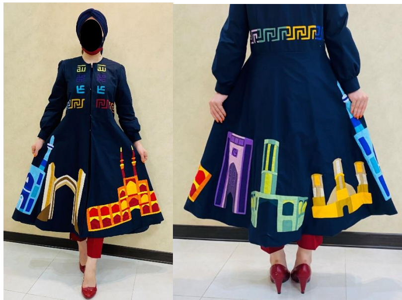
شکل ۸- دوخت نهایی پیراهن دامن