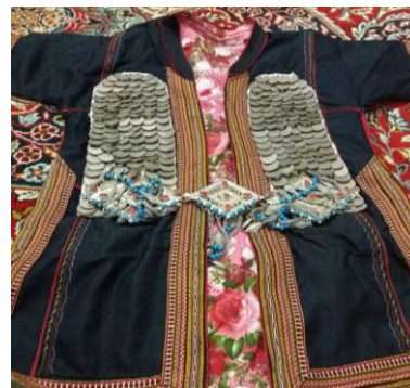
تصویر 6: لباس‌های سکه دوزی شده بانوان کلات نادری.

سکه دوزی در لباس زنان با انگیزه‌های مختلفی رایج شد که به مواردی مشخص از آن پرداخته می‌شود: