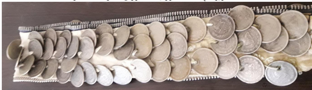
تصویر 8 چنگه باریک سکه دوزی شده.

قلایه بانوان روستای گرو واقع در شهرستان کلات نادر به این سربند قلایه میگویند. این پوشش دوکار بردار دیکه اینکه باعث نگهداشتن روسری و کلاهی ابریشمی که بر سر میبندن می شود. و مورد دیگر آن باعث زیبایی در مراسم های مختلف است. (تصویر 8)