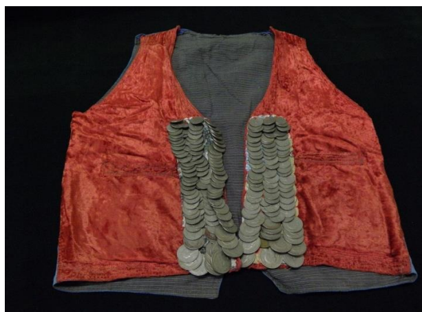
تصویر 16: جلیقه جنس مخمل وسکه دوزی شده مأخذ: موزه حرم امام رضا(ع).

( جلیقه ی که فقط در قسمت جلوی آن سکه دوخته شده ) در این تصویر جلوی جلیقه با سه ردیف سکه مزین شده که در ردیف بالای جلیقه از سکه های کوچکتر و در پایین جلیقه از سکه های بزرگتری استفاده شده ( تصویر 16 )