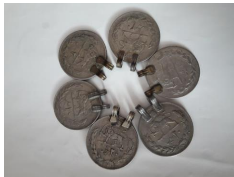
تصویر 4: سکه سوراخ شده و حلقه زده شده. مأخذ: نگارنده تصویر 5: نعل اسب برای سوراخ کردن سکه. مأخذ: نگارنده