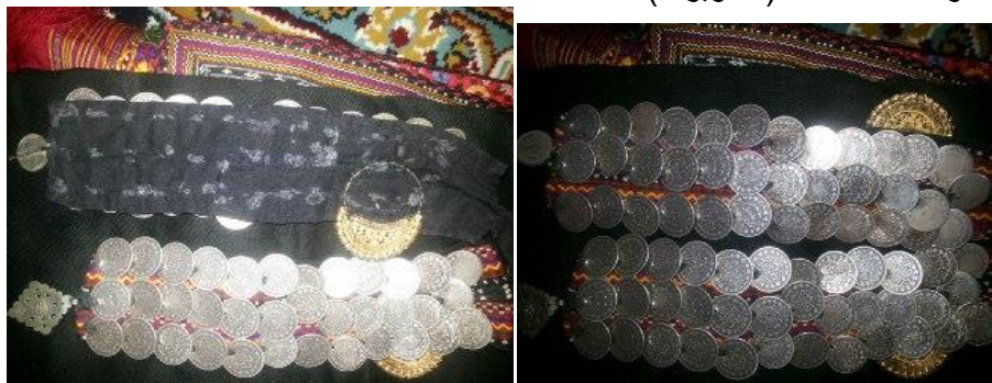
تصویر 7: چنگه سکه دوزی شده. دوران قاجار

پوشش دیده می شود که سکه های استفاده شده روی خط سکه به لباس دوخته شده است شاید برای زیبایی و مرتب به نظر رسیدن سکه ها به این صورت دوخته شده است. (تصویر 7)