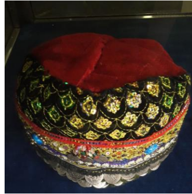
تصویر 13: کلاه سکه دوزی شده تصویر 14: کلاه سکه دوزی شده. موزه حرم