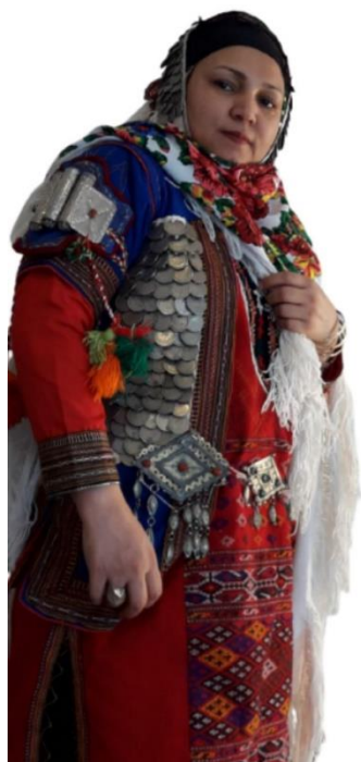
تصویر 15: جلیقه ولباس بانوان کلات نادر

( جلیقه ی که فقط در قسمت جلوی آن سکه دوخته شده ) در این تصویر جلوی جلیقه با سه ردیف سکه مزین شده که در ردیف بالای جلیقه از سکه های کوچکتر و در پایین جلیقه از سکه های بزرگتری استفاده شده ( تصویر 16 )